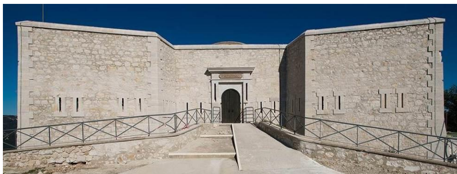
Vue extérieure de la Tour Beaumont rénovée.

Le mémorial s'intègre au site touristique global du Mont Faron, qui accueille chaque année plus de 300 000 visiteurs répartis entre, d'une part, la clientèle touristique en séjour dans le département (environ 40 escales de bateaux de croisières par an à Toulon) et, d'autre part, les résidents de l'agglomération. Bénéficiant d'un panorama exceptionnel à 530 mètres d'altitude, il propose tout au long de l'année une offre de loisirs attractive, avec notamment des circuits de randonnée et de promenade pour tous les publics. Le zoo et la chapelle Notre-Dame-du-Faron, aménagée dans une ancienne poudrière, constituent les autres points d'intérêt du site.