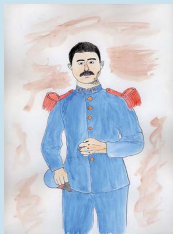
Mention pour la démarche pédagogique : Ecole de Saint-Rémy-sur-Lidoire (24)