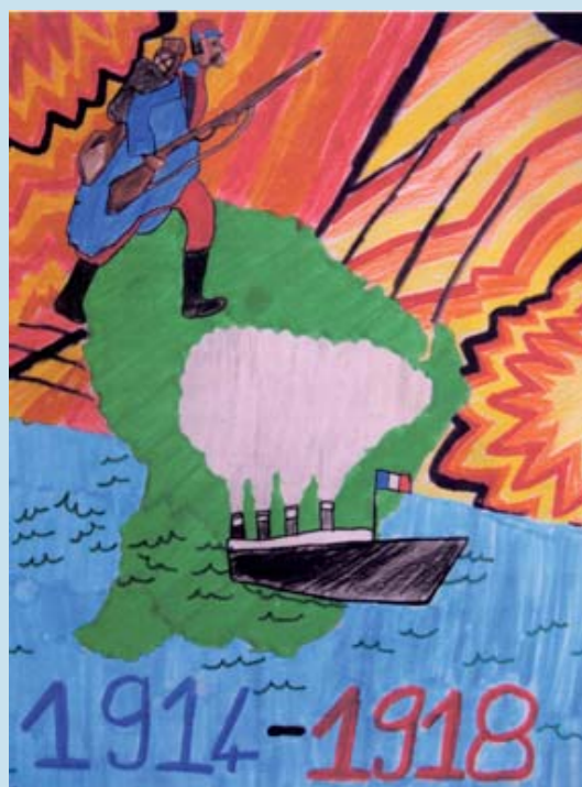
Prix de la première participation : Ecole Edmard Malacarnet de Cayenne (973)