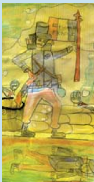
Mention pour l'originalité : Ecole des Rêpes de Vesoul (70)