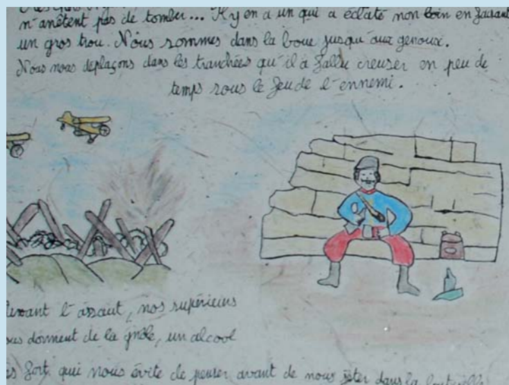
Mention pour la qualité artistique "prix Renefer" : Ecole de Saint-Chaffrey (05)