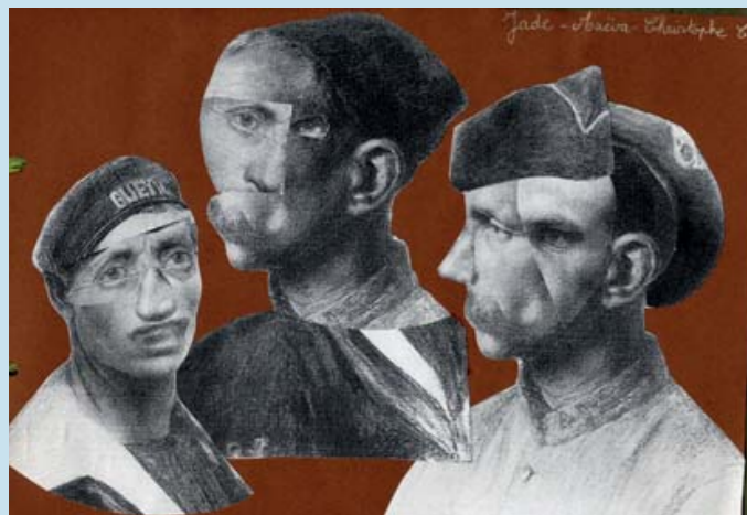
Prix spécial du jury : Ecole élémentaire du Cep à Seynod (74)