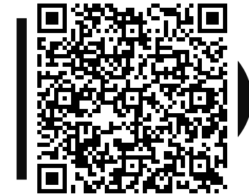
Guide de conduite des porte-drapeaux

A cet égard, le bon goût et le sens de la mesure doivent prévaloir : s'il est légitime d'arbore fièrement les distinctions officielles qui récompensent des comportements et états de service remarquables, il convient de ne pas se transformer en « arbre de Noël » avec les insignes non officiels ou associatifs. Ceux-ci sont à proscrire.